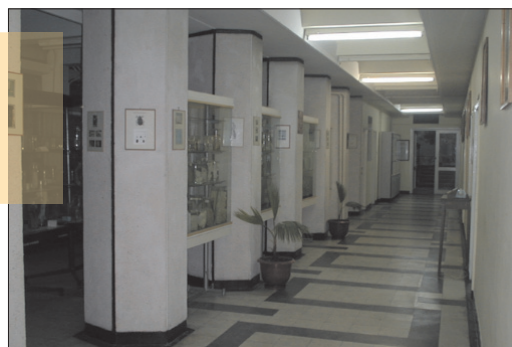
The Museum of the Department of Parasitology and Parasitic Diseases of the Faculty of Veterinary Medicine, Cluj-Napoca