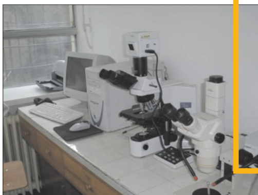
Laborator de microscopie pentru cercetare. Linie Olympus: microscop optic, cameră și lupă

În prezent, muzeul (de parazitologie comparată) ocupă circa o treime din suprafață, fiind extins și pe culoarul disciplinei. Piesele muzeistice sunt expuse în dulapuri vitrine, grupate pe trei criterii: