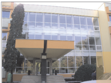
Alma Mater Veterinaria Napocensis la 45 de ani