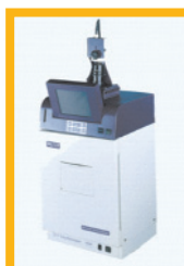
Sistem foto gel Photo gel system