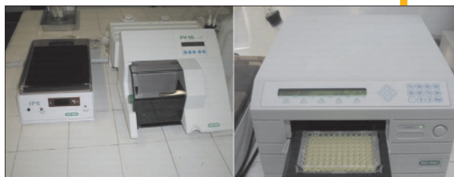
Laborator de imunologie. Linie ELISA BioRad (incubator; spălător și cititor)

At present, the museum (of compared parasitology) occupies about one third of the entire surface, extending also on the corridor of the department. The museum items are displayed in windowed-shelves and grouped according to three criteria: